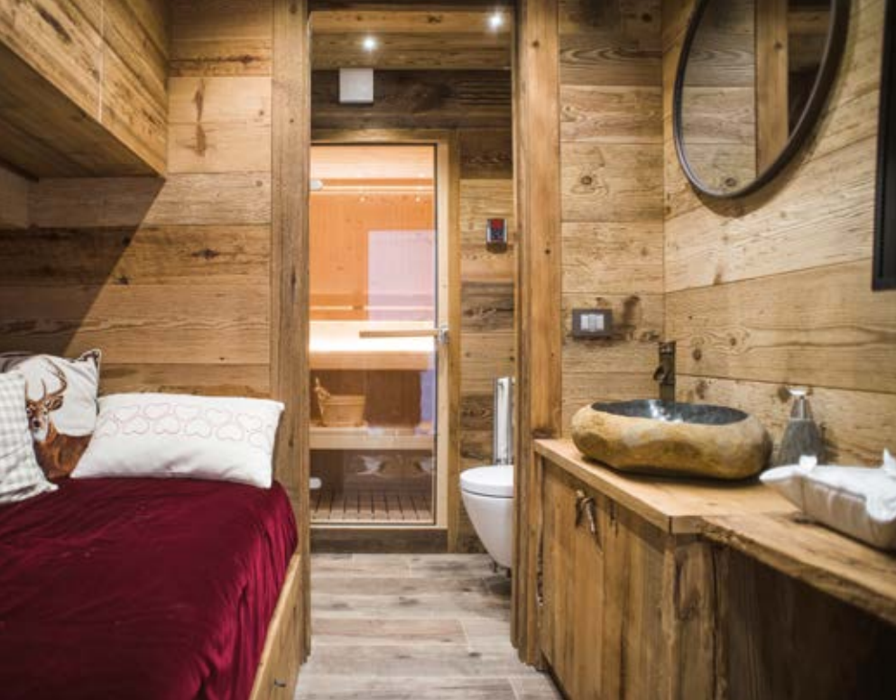
Sopra: la sauna con il lavello di pietra. Nelle altre foto: il bagno principale. Qui, la scaletta che funge da portasciugamani è un pezzo antico. Un mobile riprende il bellissimo fregio scolpito.